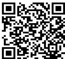
青空公園スケート場